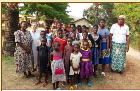
Alcuni dei bambini accolti e assistiti al Centro "Da ti nzoni be ti Jesus"

Riceviamo anche quest'anno il prezioso contributo delle vostre adozioni per le nostre bimbe orfane della Casa d'accoglienza di Bimbo a Bangui. Inutile dirvi quanto il vostro aiuto sia prezioso. Le bambine che accogliamo hanno necessità di tutto, dal cibo, ai vestiti, all'igiene, alle cure e soprattutto all'educazione-istruzione per prepararle ad una vita dignitosa e sicura. Cerchiamo tutte le occasioni per educare anche il loro cuore... Vi racconto uno dei fatti che ha commosso anche noi. La speranza più grande che sostiene e nutre la nostra attività è che queste bambine possano crescere sotto ogni punto di vista ma in particolare con un cuore buono, sensibile e generoso disposto ad aiutare chi è nel bisogno. L'occasione si è presentata quando il nostro arcivescovo ha incontrato le scuole cattoliche all'inizio dell'anno scolastico. Ha chiesto agli alunni di essere solidali con i loro compagni delle scuollette dei villaggi che non hanno la possibilità di avere dei quaderni, delle penne, delle lavagnette perché anche questi compagni possano avere la gioia di avere il necessario per poter imparare. Le nostre bimbe orfane ricevono in dono ogni anno uno zainetto con