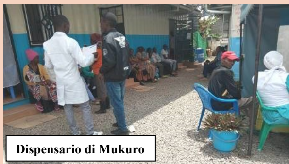
Dispensario di Mukuro