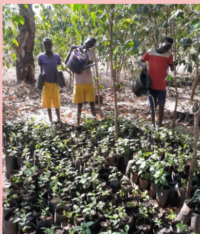
I tre ragazzi che aiutano nel vivaio di caffè.