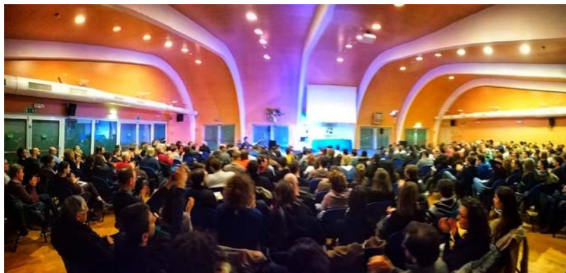
Cittadella, 18 gennaio: alta la presenza allo spettacolo "Nazieuropa"

Se le persone entrano in connessione con la mia emotività e il mio percorso intellettuale mi fa molto piacere! E questo eventualmente può spostare il loro pensiero o il loro stare al mondo ma non faccio questa cosa per convincere nessuno. Le cose le misuro su di me.